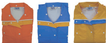
オレンジ ブルー イエロー